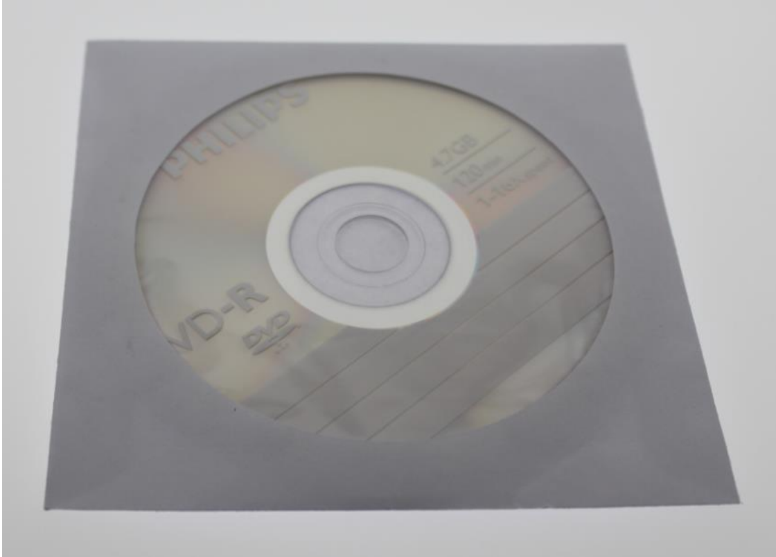
Şekil 4: Elan CDsi

Board üzerinde bulunan tüm ürünlerin dataları, örnek kodları ve gerekli tüm yazılımlar CD içerisinde bulunmaktadır.