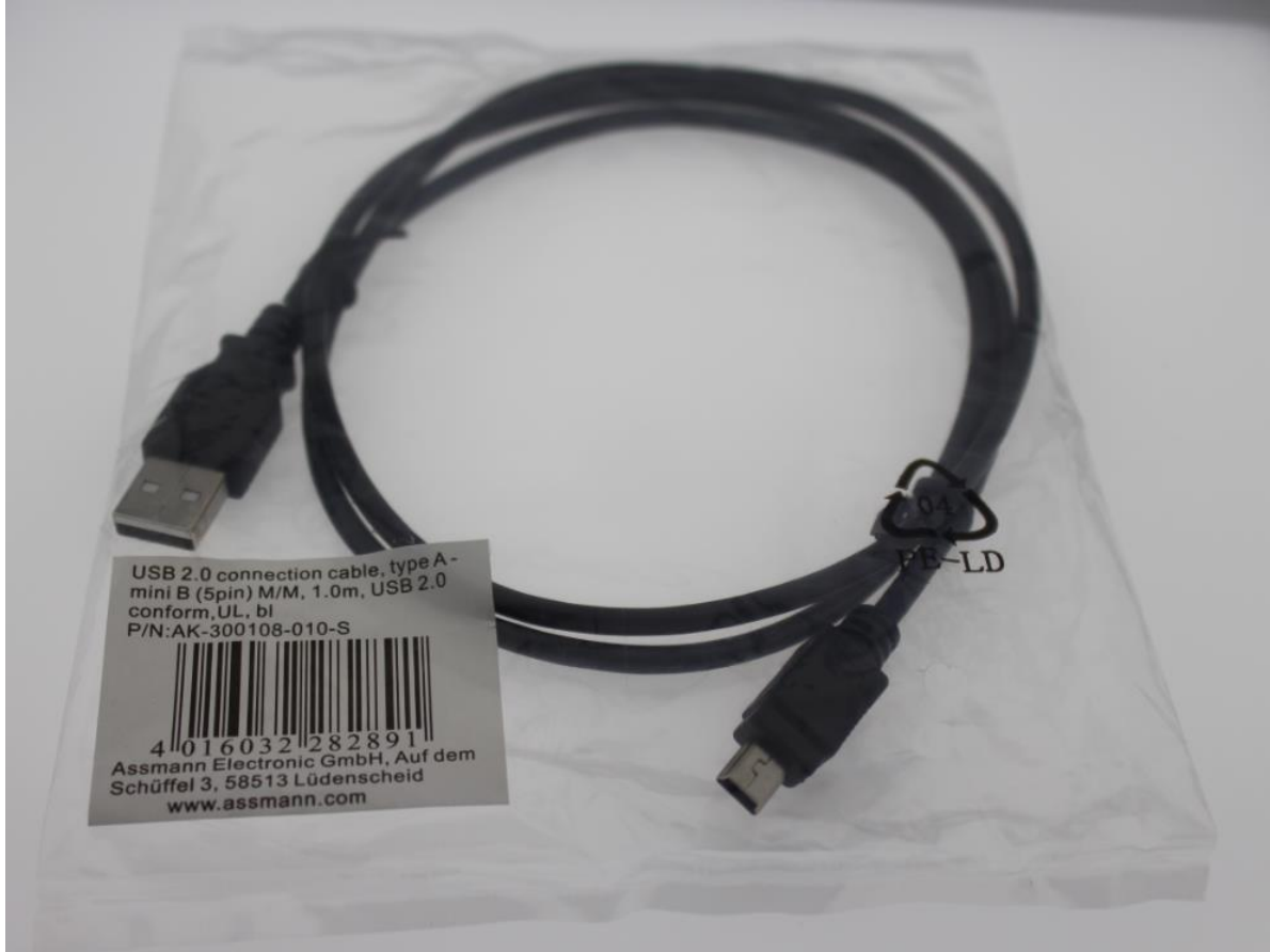
Şekil 3: USB

USB kablo PC ye takıldığında devre enerjilenir. Başka harici bir güç kaynağına gerek duyulmaz.