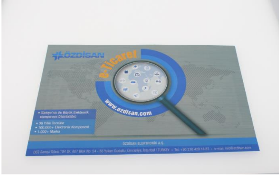
Şekil 5: E-Ticaret Broşürü

E-Ticaret Broşürü, istenilen komponente internet üzerinden sipariş yoluyla ulaşabilmenin yöntemini içermektedir.